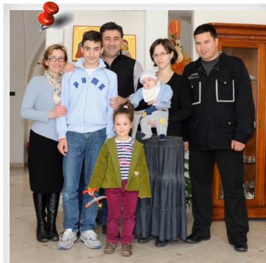
у Фортунатовом стану